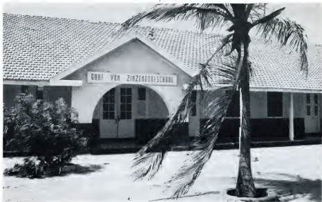
GRAF VAN ZINZENDORF BASISSCHOOL (S.P.C.O.A.): school voor protestants christelijk onderwijs.

den op de gemengde staatschool ging niet ver genoeg. Men streed voor de vrijheid van richting (lid 5), waaronder werd verstaan de vrijheid om te bepalen dat het onderwijs een godsdienstig karakter moest hebben, en wat dat karakter dan zou betekenen. Dit zou ondermeer een vrije boekenkeuze met zich mee moeten brengen, terwijl ook het aanstellen van eigen leerkrachten hiervoor noodzakelijk was, waarbij dan niet getornd behoefde te worden aan het vereiste van de akte van bekwaamheid. Ook het overheids-toezicht vormde hierbij geen belemmering. Sinds 1920 kennen wij nu de vrijheid van onderwijs, hetwelk inhoudt dat het oprichten van bijzondere scholen vrij is, met dien verstande dat de overheid een onderzoek naar de bekwaamheid en zedelijkheid van de onderwijzers kan instellen en toezicht op het onderwijs houdt (lid 2). In de Memorie van Toelichting van het wetsontwerp werd de vrijheid van onderwijs aangeduid als "het recht van de ouders, om naar hunnen be-